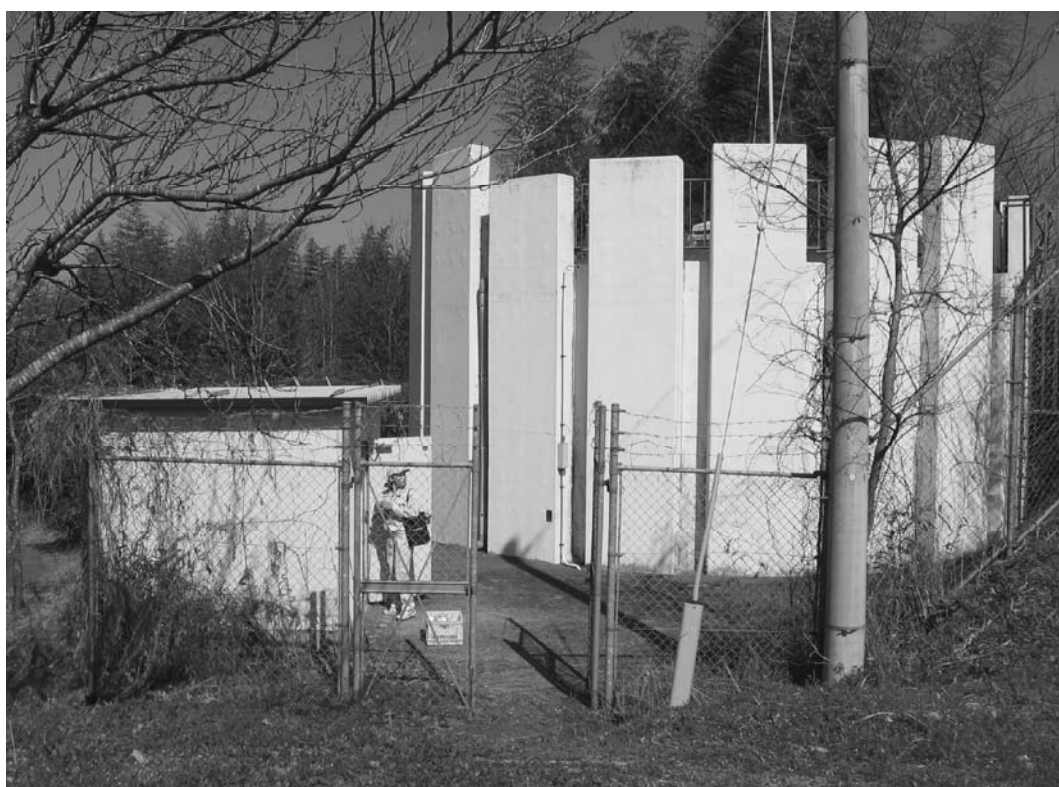
工業用水道配水池